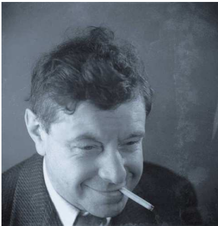
Tihanyi Lajos Bp., 1885 - Párizs, 1938.

KogArt Tihanyi Lajos – egy bohém festő Budapesten, Berlinben és Párizsban című kiállítás